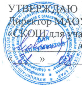
График уборки обеденного зала МАОУ «СКОШ для учащихся с ОВЗ» Октябрьская, 18